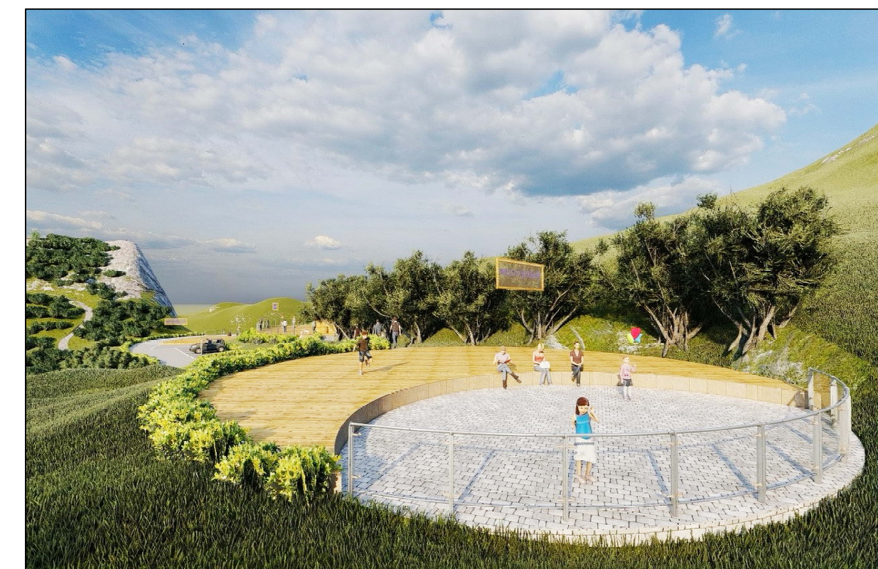
PLAZA DE LA LUNA