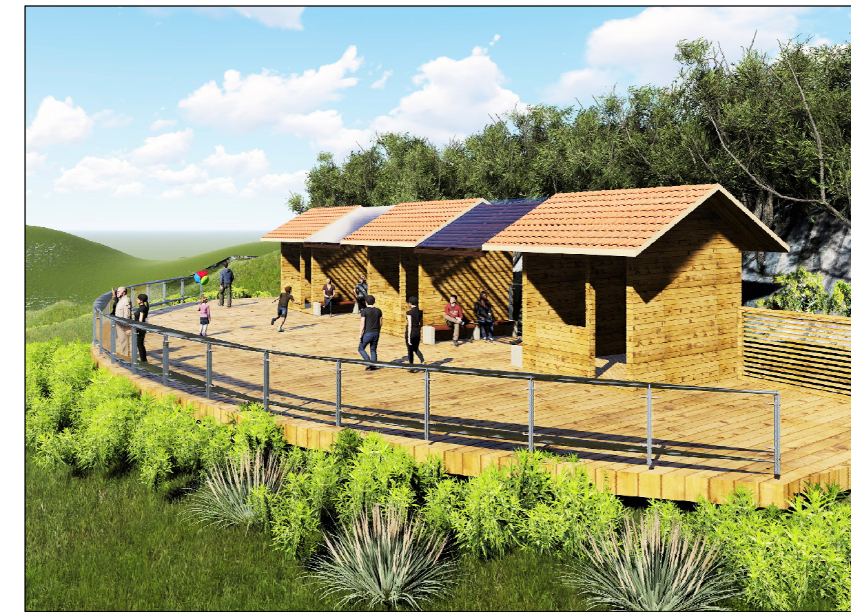
BALCON DE SERVICIOS