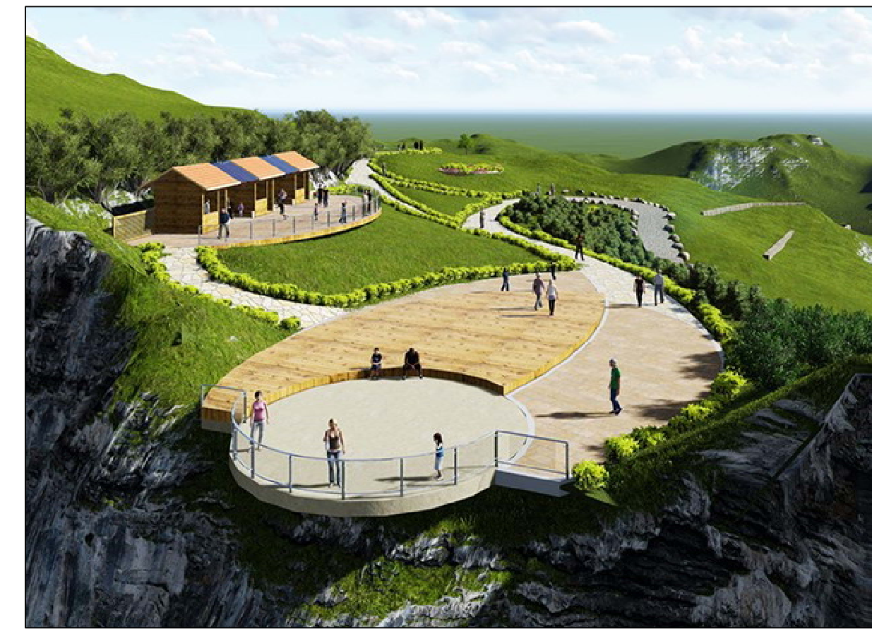
PLAZA DEL SOL