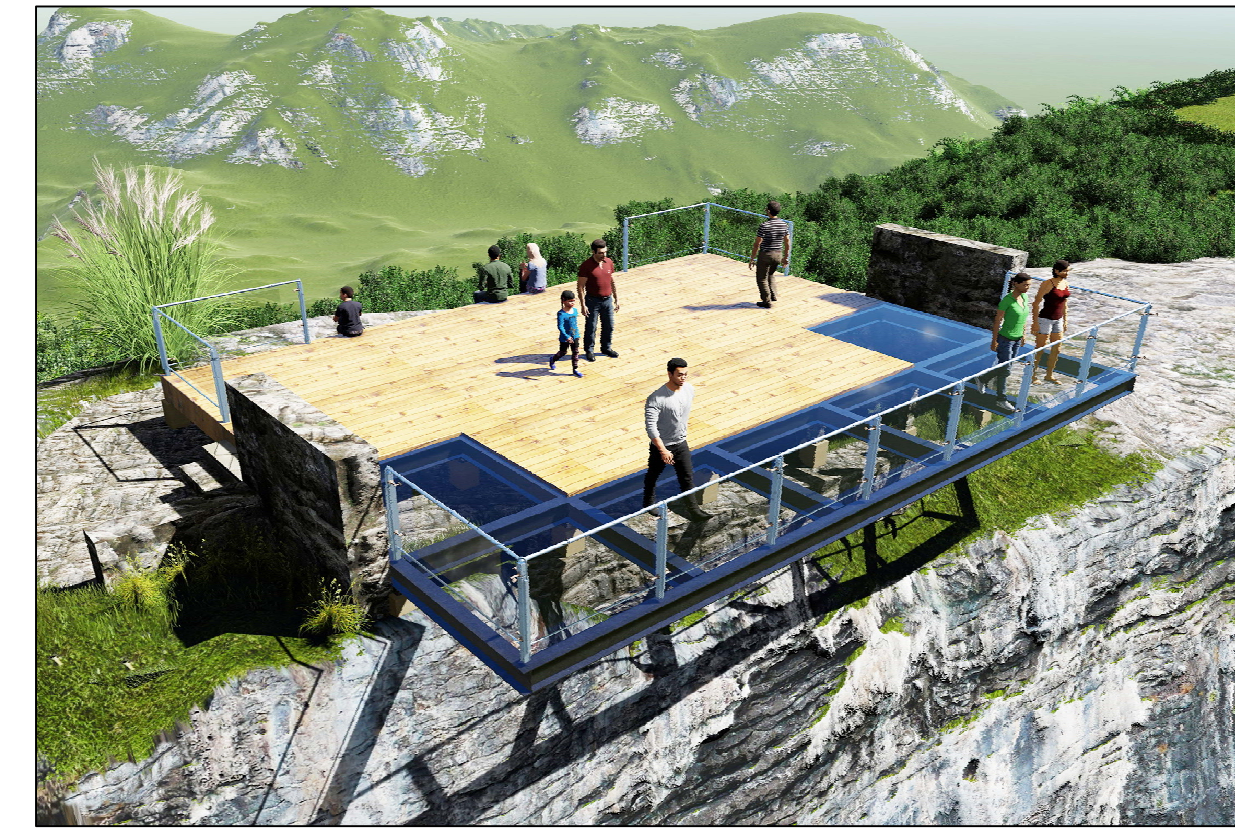
MIRADOR DE CRISTAL